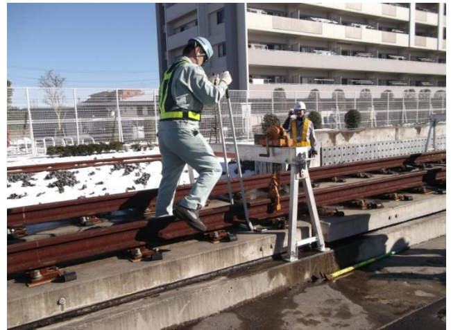
アゲレール使用状況