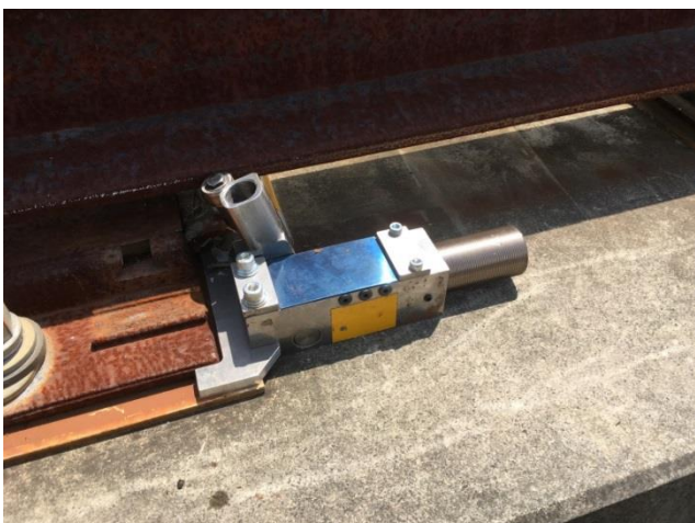
レール持ち上げ後

根本企画工業株式会社 〒276-0047 千葉県八千代市吉橋 1095-15 TEL 047-450-2611 FAX 047-450-7674 E-mail: nds@nemoto-kikaku.com